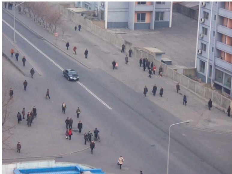
Norda Koreio estas lando de piedirantoj