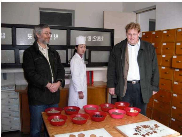
En la apoteko de la hospitalo

En Pjongjango mem iu ajn manko ne estas konstatebla. La vendoj por enlandanoj estas plenaj. Kelkaj homoj rajtas eĉ vendi private, kion ili rikoltas. En la kamparo la situacio estas alia, kiel klarigis al ni multaj evoluhelpantoj, kiujn ni renkontis en Eŭro-Bistro, renkontiĝejo de evoluhelpantoj kaj diplomatoj en la reprezentejo de Eŭropa Unio.