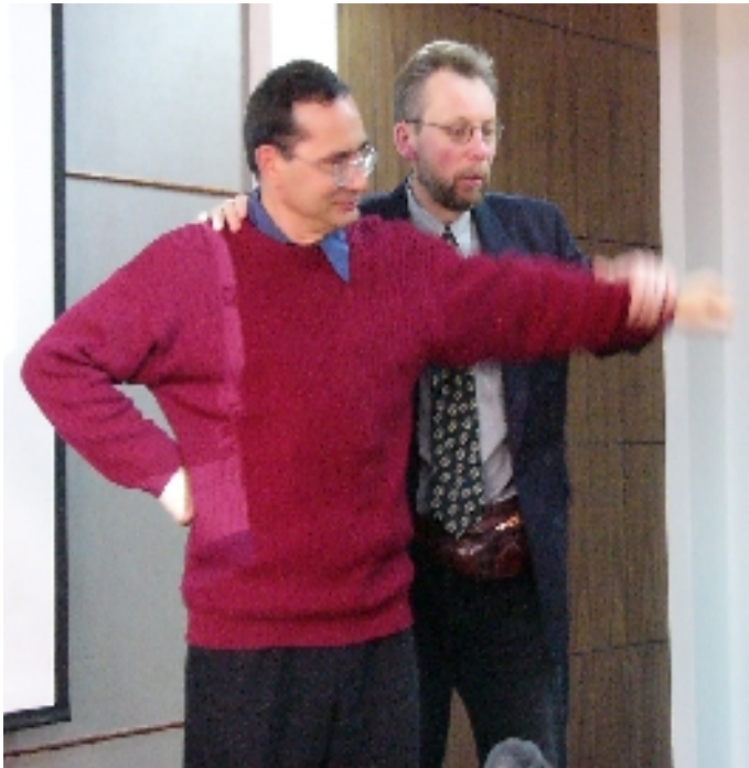
Demonstro de aplikata kineziologio

En la anktiva tempo oni diris por "Jangsengo":