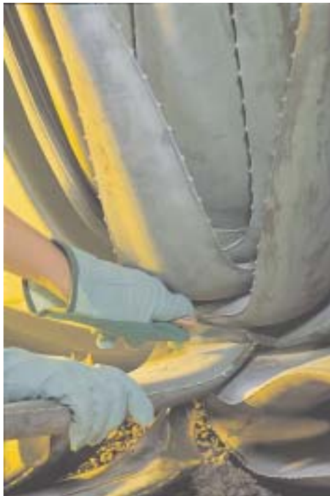
Rikolto de aloo