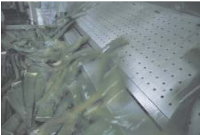
Zorga lavado de aloo

Aplikado de aloaj produktaĵoj: alergiaj, artrozo, reŭmatismaj malsanoj, bronkito, astmo, brulvundoj, haŭtmalsanoj, diabeto, gastrointestaj malsanoj, tuberkulozo, kancero, aidsos, aŭtoimunaj malsanoj, arteriosklerozo, hepatitoj, pankrestitoj, ostoporozo, okulmalsanoj (inflamoj, katarakto, glaŭkomo) prostataj malsanoj kaj klimaktero.