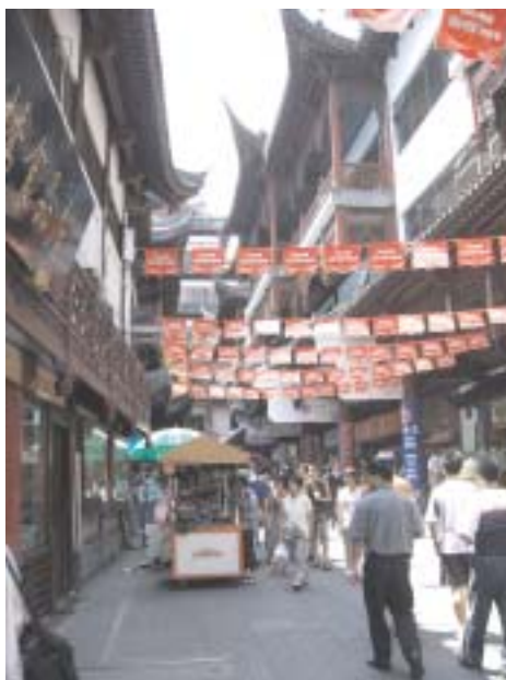
Tradicia strato en Ŝanhajo

La partoprenantoj povas loĝi farvorpreze en la gastejo de la universitato. Lito en