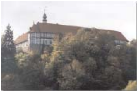
La kastelo de Herzberg; ĝi estas la plej granda kastelo en traba konstrumaniero de Malsupra Saksio (nomo de la federacia lando de Germanio).

Pri kotizoj, tranokteblecoj ktp. bv. rekte informiĝi ĉe ICH.