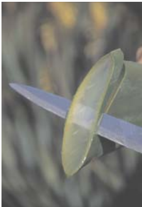
Kiam oni tranĉas aloon, ĝia internaĵo estas travidebla

Alo vera enhavas mineralaĵojn: kalion, fosforon, kalcion, feron, manganon, natrion, kloron, magnezion, kupron, kromon kaj zinkon. Ĝi enhavas polisakaridojn: celulozon, glukozon, manozon, aldozon kaj ramnozon. La enhavo de aminoacidoj: aspartata acido, glutamata acido, alanino, arginino, cistino, glicerolo, histidino kaj hidroksiprolino, kiuj