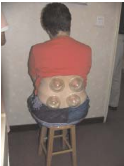
Dum la kupado

Ni spertis kupadon, kiun oni ankaŭ uzas en Germanio, kaj akupunkturaron. La principo de la kupado estas krei vakuon. Tiel sango el pli profundaj tavoloj, ekz. internaj organoj venas al la haŭto kaj senŝarĝigas la organojn. Tion ni nomas