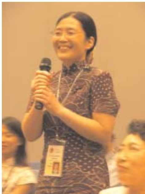
Unu el multaj demandintoj

La kuracendaj akupunkturaj punktoj ne dependas de iu ajn malsano, sed de la kompleksio, kun kiu ĉiu homo naskiĝas.