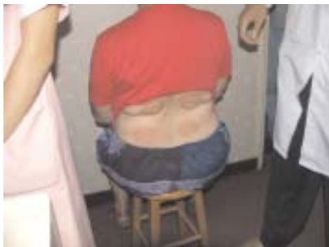
Post la kupado