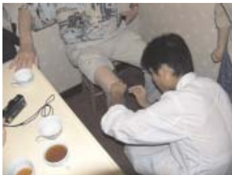
Dum la akupunkturo

Ankaŭ por la akupunkturo troviĝis partoprenanto, kiu volis sperti ĝin pro siaj genudoloroj.