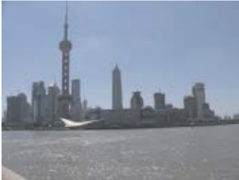
Urbo de la 2-a INA-Konferenco: Ŝanhajo. Jen la vido al la plej moderna kvartalo Pudong.

Post la sukceso de la 1-a INA-konferenco en Krefeld, Germanio, de la 19-a ĝis 24-a de aŭgusto 2002, la estraro decidis okazigi 2an INA-konferencon.