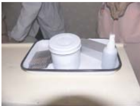
Iloj por la akupunkturo: unufojaj pingloj, skatolo kun vato, haŭta desinfektilo

Tiu parto por mi estis tre interesa, ĉar mi uzas tute alian kuracadon por genudoloroj. Tamen la esplorado estas tre simila. Ankaŭ mi esploras la genuon palpante la dolorajn punktojn. Anstataŭ pinglumi ilin, mi injektas kvanteton de homeopatia medikamento en la haŭton, kie troviĝas la dolorpunktoj.